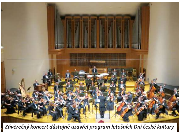
Závěrečný koncert důstojně uzavřel program letošních Dní české kultury

Závěrečný koncert festivalu jako obvykle připravila Státní filharmonie v Košicích a mohli jsme si na něm vyslechnout hudbu Josefa Myslivečka a první tři části Smetanovy Mé vlasti.