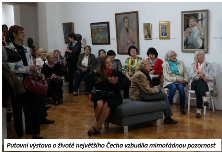
Putovní výstava o životě největšího Čecha vzbudila mimořádnou pozornost