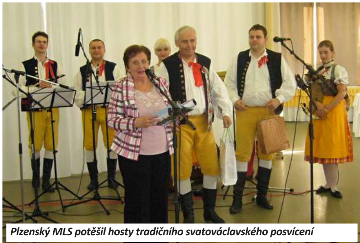
Plzeňský MLS potěšil hosty tradičního svatováclavského posvícení

Letošní ročník Dnů české kultury byly už dvacátým třetím v pořadí. Za ta léta, co Český spolek v Košicích tento jediný festival české kultury na Slovensku pořádá, se v něm vystřídaly desítky účinkujících, někteří i opakovaně. Při přípravě každého dalšího ročníku vždy přemýšlíme, čím zaujmout, co z české kultury do Košic a několika dalších měst východního Slovenska přivést, aby to bylo divácky zajímavé. Sami návštěvníci letošního ročníku ať posoudí, zda se nám to povedlo. My, organizátoři, z velmi pěkné návštěvnosti všech programů a reakce publika usuzujeme, že snad ano.