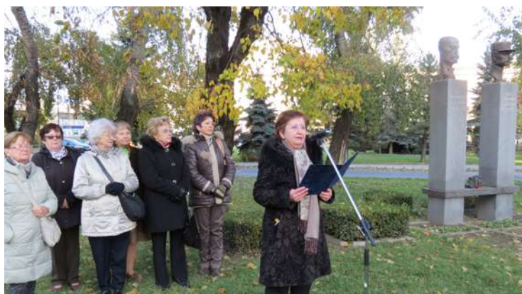
K DČK neodmyslitelně patří i hold zakladatelům společného státu

I s úvodní svatováclavskou bohoslužbou a závěrečným slavnostním shromážděním u Masarykova a Štefánikova pomníku tedy třicet programů.