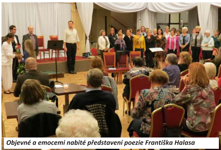
Objevné a emocemi nabitě představení poezie Františka Halasa

Literárně hudební programy byly ve dnech české kultury 2016 ještě další dva. Už vím, co číst a poslouchat, o mágovi české populární hudby Karlu Svobodovi a program s názvem Hlas domova, poezie v próze básníka Františka Halase, zejména jeho Já se tam vrátím, provázené hudbou a zpěvem a scénicky zpracované.