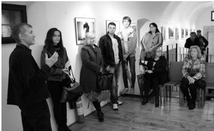
Výstava Czech Press Photo v Prešově zaujala zejména mladé

kde je dobře rozvinuta spolupráce se školami a pro studenty byla výstava přínosem v jejich přehledu evropské literatury.