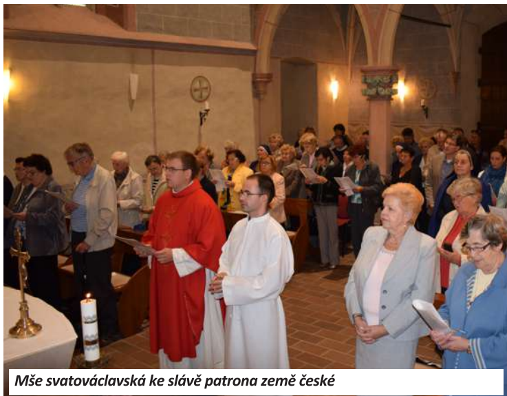
Mše svatováclavská ke slávě patrona země české

Léta zachováváme osvědčenou základní strukturu programu – hudební programy, literární programy, výstavy, něco pro děti a vždy je to nejen v Košicích, ale i mimo ně. Osvědčený a sehraný je i realizační tým a nesmírně cenným prvkem jsou každý rok spolupracující místní kulturní instituce, mnohé z nich stálé. S potěšením každý rok konstatujeme, že z české kultury není problém vybrat vhodné programy. A protože financování festivalu ze slovenské strany je zatím stabilizované a Ministerstvo zahraničních věcí České republiky i letos přispělo významným dílem, vypadá to možná z pohledu zvenčí jako snadná záležitost. Není tomu tak. Jen organizátoři vědí, kolik desítek zásadních věcí i detailů, a těch zejména, stojí za úspěchem každého ročníku. Tak to tedy pro letošek máme za sebou a těm, kteří nestihli všechno z bohaté nabídky programu, přinášíme aspoň trochu povídání o tom, jaké to bylo.